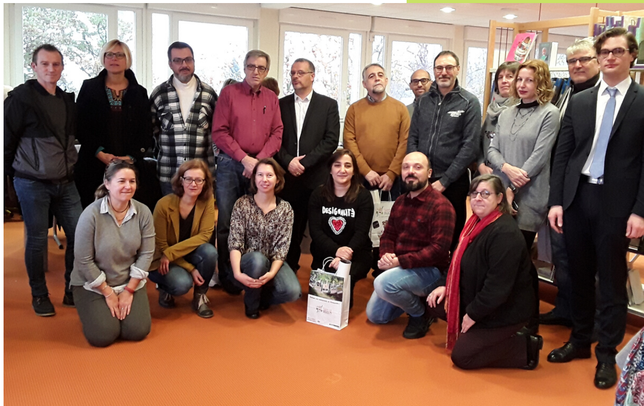
L'ensemble des équipes reçues par les personnels de direction des collèges de Bény-Bocage et de Torigny-les-Villes, ainsi que par les enseignants, les représentants des parents d'élèves et des élus torignais.