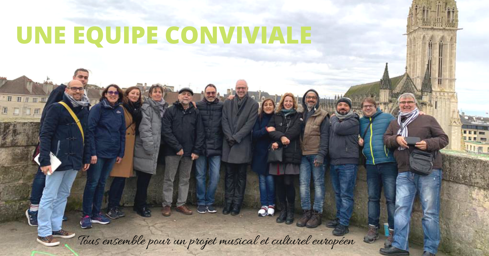
Tous ensemble pour un projet musical et culturel européen